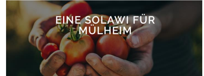
SoLaWi Mülheim, o.D.